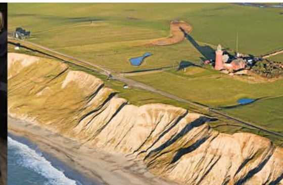
DN Lemvig handler om naturen, men også om sammenhold og fællesskab.